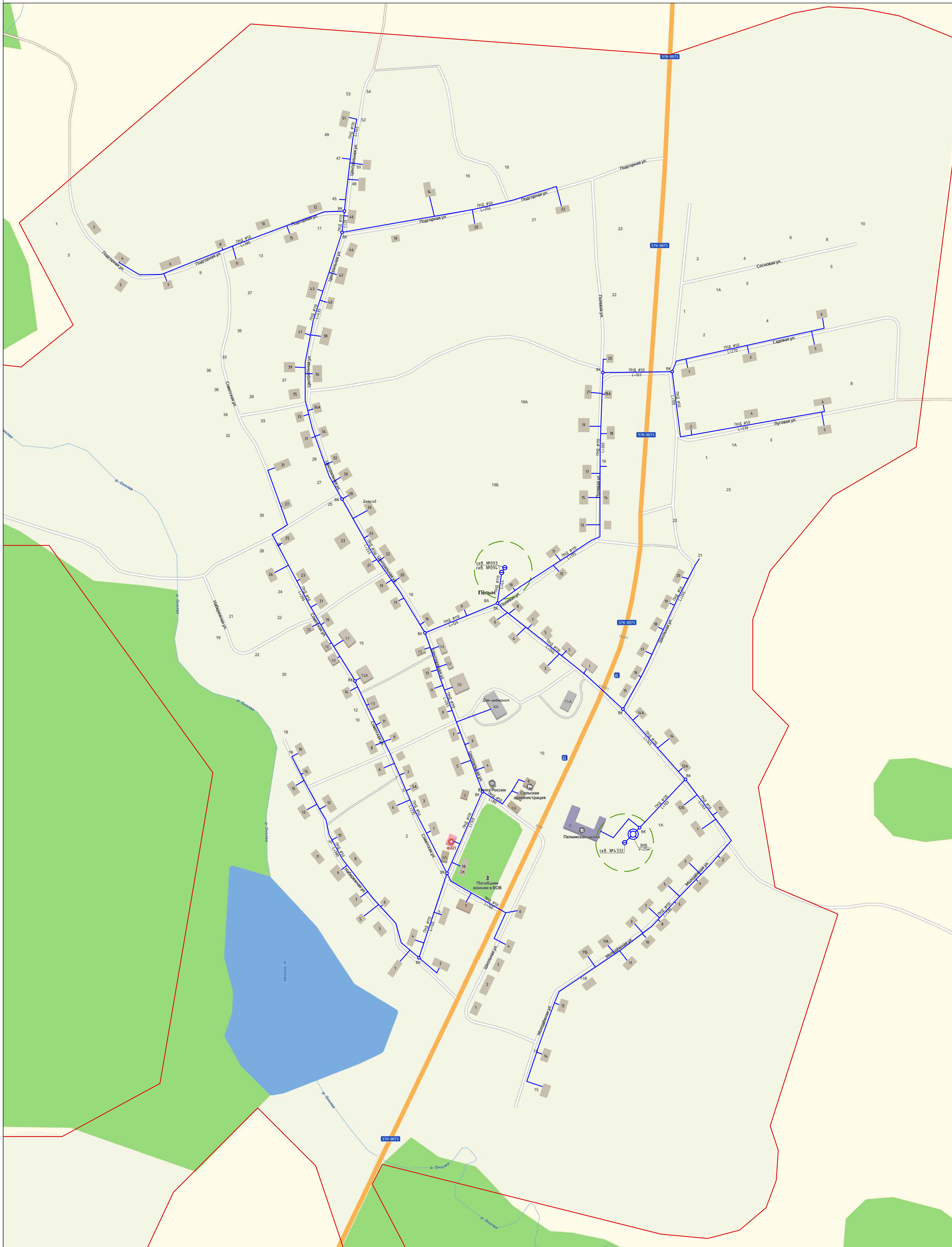
Схема централизованного водоснабжения с. Пельим Кочевского муниципального округа